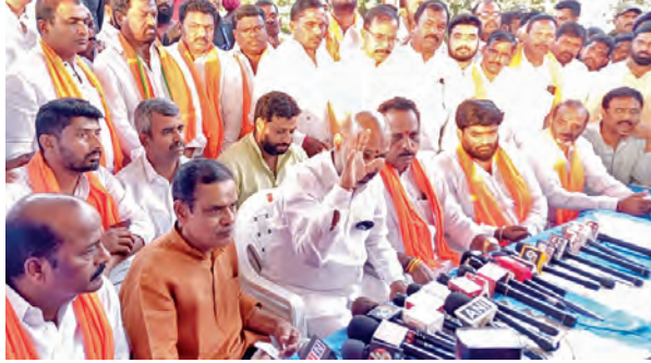
శుక్రవారం మీడియాతో మాట్లాడుతున్న కేంద్రమంత్రి బండీ సంజయ్

ఒటిపీ చెప్పొద్దంటున్న పోలీసులు ప్రభాతవార్త ప్రధాన ప్రతినిధి, హైదరాబాద్, నవంబరు 8: తెలంగాణలో సరికొత్త సైబర్ ప్రాచీన నేరగాళ్లు తెలంగాణ పోలీసులు చెబుతున్నారని. మూడు రోజుల క్రితం రాష్ట్ర ప్రభుత్వం ప్రారంభించిన సమగ్ర కుటుంబ సర్వేను తమకు అనుకూలంగా మార్చుకున్నారని. ఈ సర్వే పేరుతో లింక్ లు పంపించి బ్యాంకు ఖాతాలను కొల్లగొడుతున్నారని హెచ్చరించారు. కుటుంబ సర్వే పేరుతో మొబైల్ ఫోన్ కు ఎలాంటి లింక్ వచ్చినా ఓపెన్ చేయొద్దని సూచించారు. ఒకవేళ ఈ లింక్స్ నిజమే అనుకుని క్లిక్ చేస్తే బ్యాంకు ఖాతాలోని సొమ్ము మొత్తం కాజేస్తారని చెప్పారు. దీంతో పాటు కుటుంబ సర్వే పేరుతో ఎలాంటి ఫోన్ కాల్ వచ్చినా స్పందించవద్దని సైబర్ పోలీసులు హెచ్చరించారు. సర్వే కోసం కాల్ చేశామని చెప్పి ఓటిపీ అడిగితే ఎట్టిపరిస్థితుల్లోనూ చెప్పొద్దన్నారు. ఈ నెల 6 నుంచి తెలంగాణ వ్యాప్తంగా సమగ్ర కుటుంబ సర్వే ప్రారంభమైంది. ఈ సర్వే కోసం అధికారులు, ప్రభుత్వ సిబ్బంది నేరుగా మీ ఇంటికే వస్తారని, వివరాలు నమోదు చేసుకుని వెళ్తారని సైబర్ పోలీసులు స్పష్టత నిచ్చారు. ఫోన్ ద్వారా, ఆన్ లైన్ లింక్ ల ద్వారా సర్వే చేయడంలేదని వివరించారు. ఈ సర్వే పేరుతో ఏదైనా లింక్ లు కానీ ఫోన్ కాల్ కానీ వస్తే స్పందించవద్దని సూచించారు. సైబర్ నేరగాళ్ల వలతో పడకండా జాగ్రత్తగా ఉండాలంటూ ముందుగానే ప్రజలను అప్రమత్తం చేస్తున్నారు.